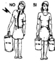
BILANCIARE SEMPRE I CARICHI