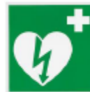
CASSETTA DI PRIMO SOCCORSO