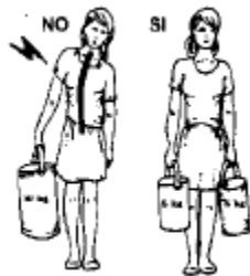
BILANCIARE SEMPRE I CARICHI